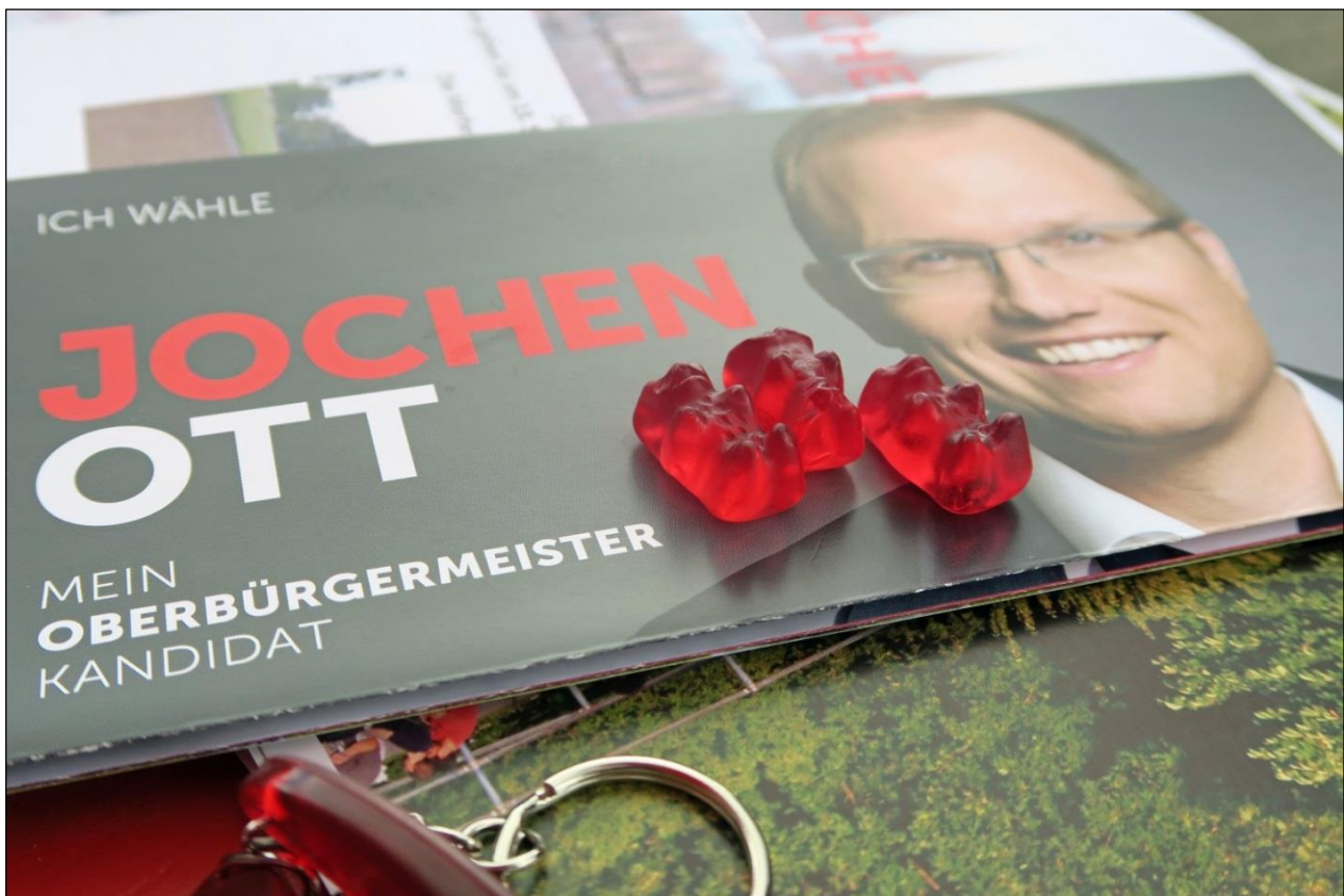
Rote Bärchen mit klarer Aussage am Wahlkampfstand

Schon immer habe ich mich für die Entwicklung der rechtsrheinischen Quartiere eingesetzt. Der Erfolg gibt uns Recht. Mülheim 2020 ist solch ein Erfolg, Deutz und Kalk werden immer attraktiver. Und auch Porz hat mehr Augenmerk und Unterstützung für seine Entwicklung verdient. Durch diese Erfolge gewinnt die ganze Stadt.