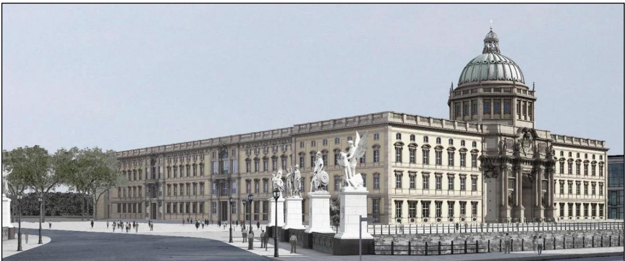
Modellskizze der Nord-West-Fassade des Stadtschlusses, in dem 2019 das Humboldt-Forum eröffnet wird

Im Ausschuss für Kultur und Medien begleitet der Deutsche Bundestag das Projekt sehr intensiv. Bis im Jahr 2019 eröffnet werden kann, müssen noch viele Fragen geklärt werden. Doch schon jetzt wird deutlich, welche überzeugende Idee dahinter steckt. Das Humboldt-Forum ist eine einzigartige Chance, in der Mitte der deutschen Hauptstadt eine Offenheit für die Kulturen der Welt zum Ausdruck zu bringen, die sich mit vergleichbaren Gebäuden wie dem Louvre in Paris mehr als messen lassen kann.