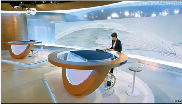
Das neue Nachrichtenstudio

Am 22. Juni wurde im Rahmen des Global Media Forums in Bonn der Startknopf für das neue englische Fernsehprogramm der Deutschen Welle gedrückt. Vor den rund 2.000 anwesenden Gästen aus Politik und Medien betonte Intendant Peter Limbourg , wie wichtig dieser Schritt sei, um einerseits den Anforderungen der Zielgruppen gerecht zu werden und andererseits im globalen Wettbewerb der Meinungen zu bestehen.