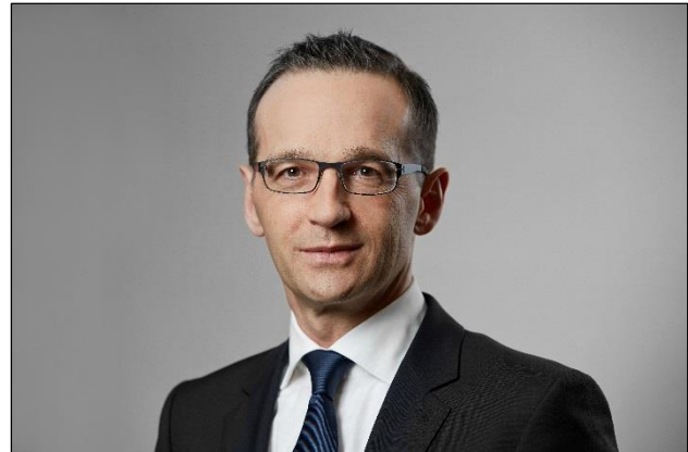
Bundesjustizminister Heiko Maas

Im Einzelnen sieht der neue Gesetzentwurf vor, dass die Pflicht zur Speicherung von Verkehrsdaten auf nur zehn Wochen beschränkt ist. Die auf Grund dieses Gesetzes gespeicherten Daten müssen unmittelbar nach Ablauf der Speicherfrist gelöscht werden. Kommt der Provider der Löschverpflichtung nicht nach, wird das mit einer Geldbuße belegt. Standortdaten dürfen nur vier Wochen gespeichert werden. Denn: Die Speicherung von Standortdaten ist ein besonders intensiver Eingriff, weil über Funkzellendaten der Aufenthaltsort des Mobilfunknutzers bestimmt werden kann und die SPD-Fraktion nicht will, dass mittels dieser Daten Bewegungs- und Persönlichkeitsprofile erstellt werden.