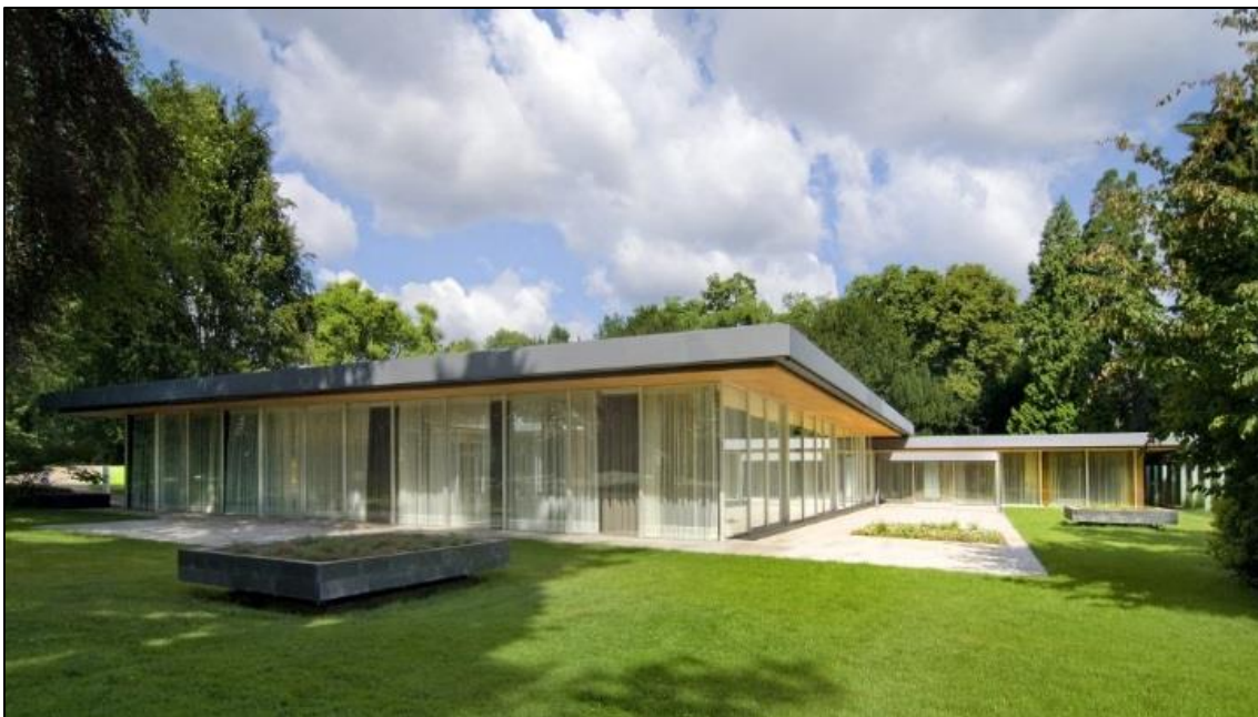
Neben dem Besuch der Ausstellungen im Haus der Geschichte steht eine Besichtigung des historischen Kanzlerbungalows auf dem Bonn-Programm

Das Moped des einmillionsten Gastarbeiters, das Kostüm des ersten schwarzen Karnevalsprinzen, die Gasflaschen des gescheiterten „Kofferbombers von Köln“: Deutschland als Einwanderungsland hat viele Gesichter und Geschichten, die in der Ausstellung aus unterschiedlichen Perspektiven erzählt werden.