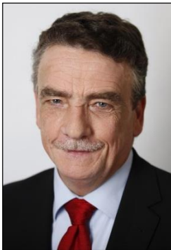
Michael Groschek Minister für Bauen, Wohnen, Stadtentwicklung und Verkehr des Landes NRW

Michael Groschek und Jochen Ott sprechen zum Thema: „Stadt und Land für die rheinische Metropole Köln“