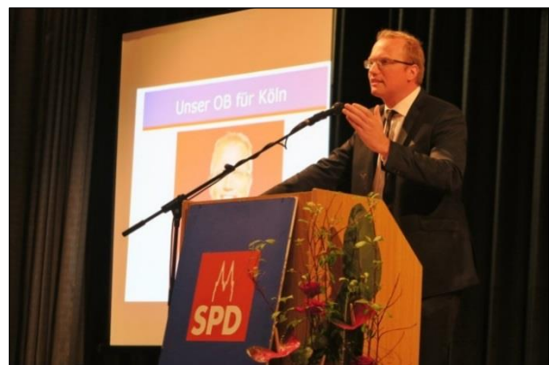
Der OB-Kandidat zeigte sich in seiner Rede entscheidungsfreudig und zukunftsgerichtet

Im Anschluss an die Reden folgte die Verleihung des Norbert-Burger-Preises. Diesen sicherte sich der Stadtbezirk Kalk mit seinem innovativen Projekt des 'Roten Frühstücks'. Ein Aktionsformat, das zeigt, dass der direkte Kontakt zu den Menschen und die Einbindung in die politische Diskussion vor Ort nicht nur ein Herzensanliegen der Kölner Sozialdemokratie ist, sondern auch gehörig Spaß machen kann!