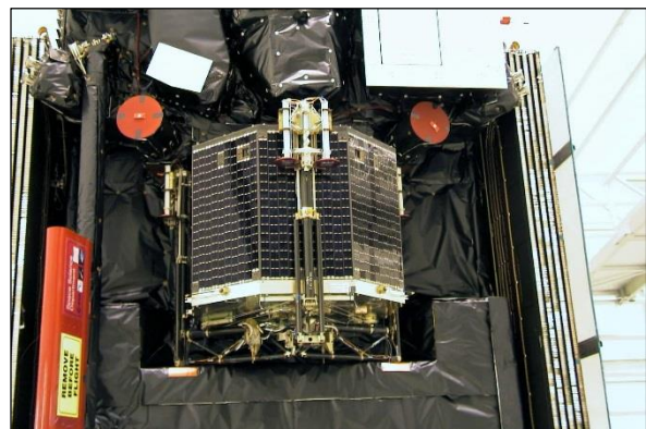
Der Lander „Philae“ vor dem Start

Da Kometen wie ein kleiner Kühlschrank besonders ursprüngliches Material aus der Zeit der Entstehung des Sonnensystems konservieren, werden die gewonnenen Daten den Blick zurück in die Kinderstube des Sonnensystems ermöglichen. 500 Millionen Kilometer entfernt von der Erde erforscht Philae also die Vergangenheit unseres Sonnensystems.