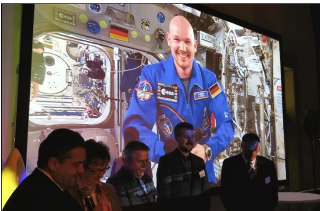
Live-Gespräch von Wirtschaftsminister Sigmar Gabriel mit unserem deutschen Astronauten Alexander Gerst kurz vor seiner Rückkehr von der Raumstation ISS

Ein Highlight war sicher der Außeneinsatz am 8. Oktober 2014. Sechseinhalb Stunden waren er und ein Kollege allein im All. Sie hatten die ISS verlassen, um Wartungsarbeiten durchzuführen - streng überwacht von Raumfahrtexperten im ESA-Zentrum in Köln. Im dortigen Astronautenzentrum :envihab wird er derzeit medizinisch untersucht und betreut - wobei ihm die Ärzte bereits unmittelbar nach seiner Rückkehr einen guten Gesundheitszustand bescheinigt hatten. Nun sei er aber erstmal froh, wieder auf der Erde zu sein, sagte der Astronaut. „Ich hab mich riesig drauf gefreut, wieder zurück zu sein.“