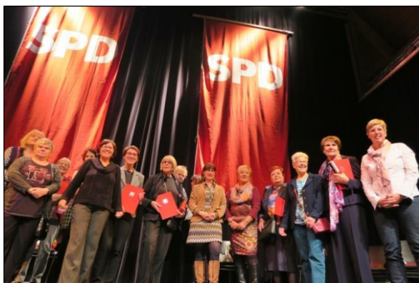
Gruppenbild: Sozialdemokratische Frauenpower bei der traditionellen Jubilarehrung der KölnSPD in Nippes