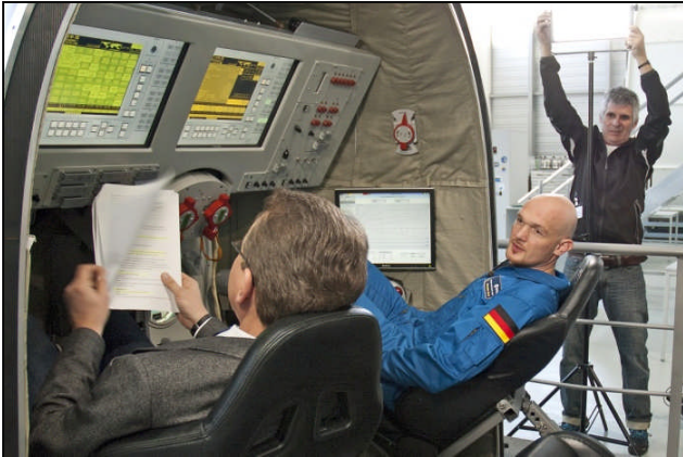
Gespräch im Sojus-Simulator

Ende Februar traf sich Martin Dörmann im Rahmen eines Filmprojekts mit dem Astronauten Alexander Gerst im Europäischen Astronauten Zentrum (EAC) in Köln.