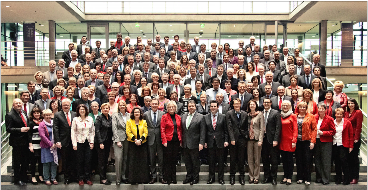
Ein starkes Team: die SPD-Bundestagsfraktion am Rande ihrer Klausurtagung im März