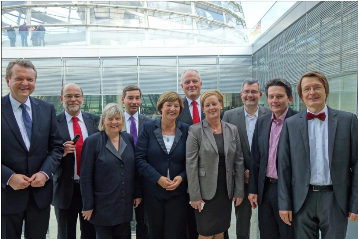
Die SPD-Bundestagsabgeordneten aus der Region Mittelrhein