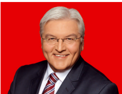
Dr. Frank-Walter Steinmeier