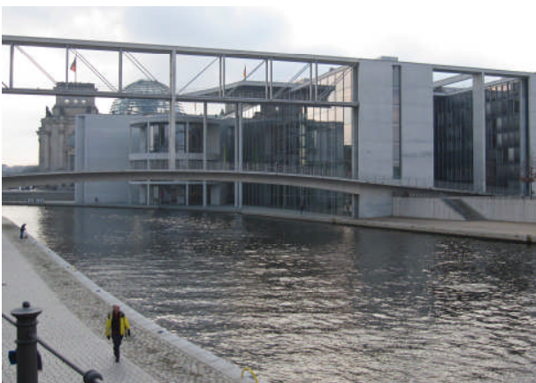
Das neue Büro befindet sich im obersten Stock des Paul-Löbe-Hauses (auf dem Foto rechts) und hat einen seitlichen Blick zur Spree hin