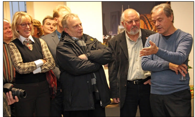
Der Journalist erläuterte den Gästen, was ihn an den alten Menschen besonders faszinierte