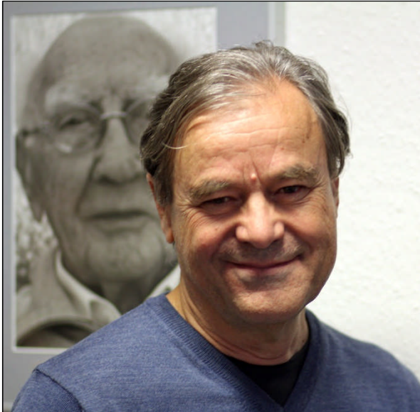
Roland Schriefer portraitierte für den Kölner Stadt-Anzeiger Hundertjährige. Seine schönsten Fotografien sind nun im Bürgerbüro Porz zu bewundern

Wie es mittlerweile schöne Tradition geworden ist, fand am 16. November wieder ein Herbstempfang der SPD-Abgeordneten im Bürgerbüro Porz statt.