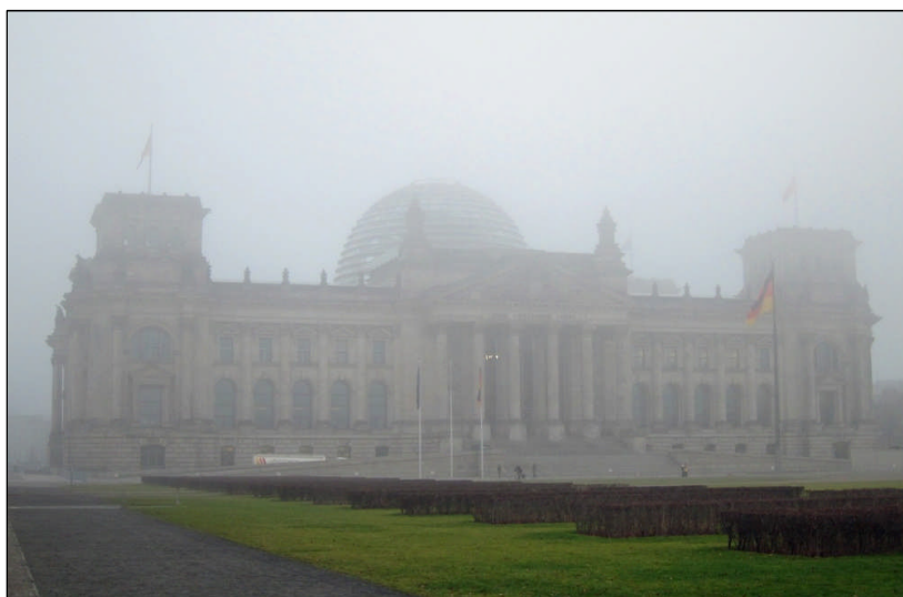
Passend zur Haushaltspolitik der schwarz-gelben Koalition war der Reichstag im November in Nebel gehüllt

In den parlamentarischen Beratungen hat sich gezeigt, dass der Koalition für strukturelle Maßnahmen die politische Kraft fehlt. Nur Trickserien helfen der schwarz-gelben Regierung, in die Nähe der eigenen Ziele zu gelangen. Gleichzeitig beschließt die Regierungskoalition zusätzliche Ausgaben für Wahlgeschenke und unsinnige neue Leistungen wie das Betreuungsgeld. Einige Ausgaben, z. B. für Rad-dampfer und Militärmuseen, läuten den Wahlkampf ein.