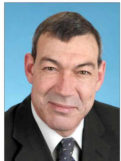
Anton Schaaf ist Rentenexperte der SPD-Bundestagsfraktion

Wir setzen Maßstäbe für die zukünftige Alterssicherung. Die politischen Mitbewerber werden es schwer haben, dem etwas Gleichwertiges entgegenzusetzen. Ihnen fehlt das klare Bekenntnis zur gesetzlichen Rentenversicherung, daher vermögen auch ihre „Rezepte“ nicht zu helfen.