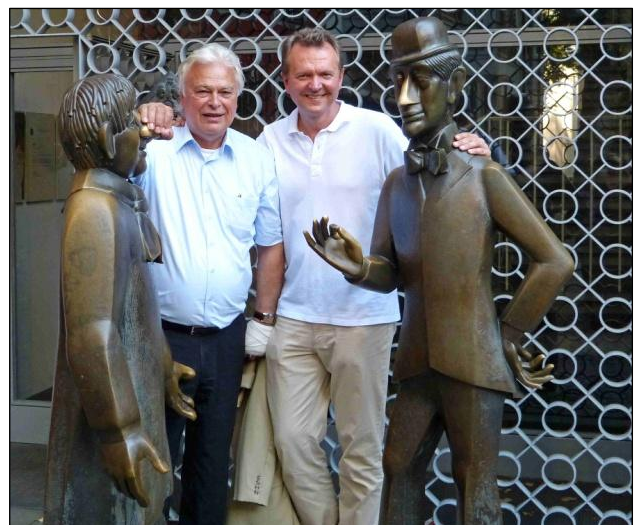
Altstadtrundgang „Kölner Märchen und Sagen“

Zusammen mit Bürgerinnen und Bürgern aus dem Wahlkreis fand erneut ein Besuch des Zentrums für Luft und Raumfahrt statt. Stationen des umfangreichen Programms waren diesmal das Europäische Astronautenzentrum, der Sonnenofen, das Nutzerzentrum für Weltraumexperimente sowie weitere Institute.