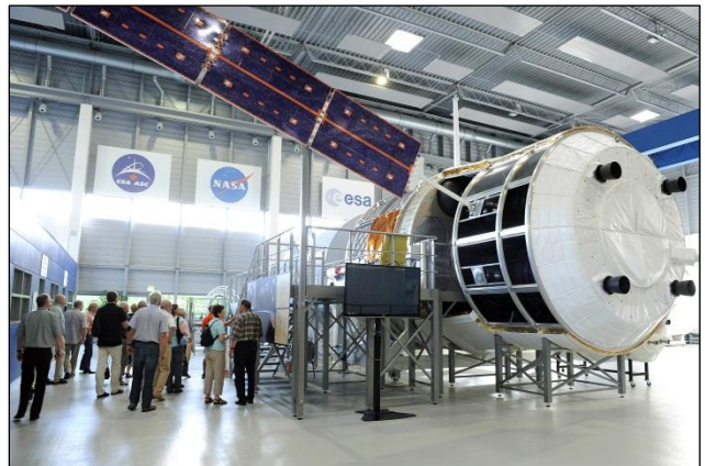
Führung mit Besuchergruppe im Europäischen Astronautenzentrum der ESA

Zusammen mit Bürgerinnen und Bürgern aus dem Wahlkreis fand erneut ein Besuch des Zentrums für Luft und Raumfahrt statt. Stationen des umfangreichen Programms waren diesmal das Europäische Astronautenzentrum, der Sonnenofen, das Nutzerzentrum für Weltraumexperimente sowie weitere Institute.