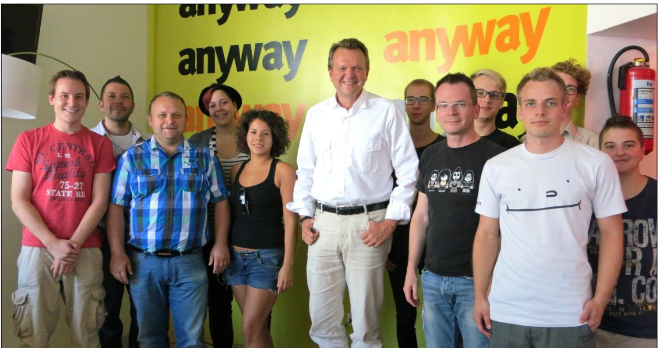
Besuch im schwul-lesbischen Jugendzentrum „anyway“

Die Route bildete den Abschluss des Sommerprogramms. Insgesamt brachten die Begegnungen wieder viele neue Erkenntnisse und Kontakte für die weitere Arbeit als Abgeordneter.