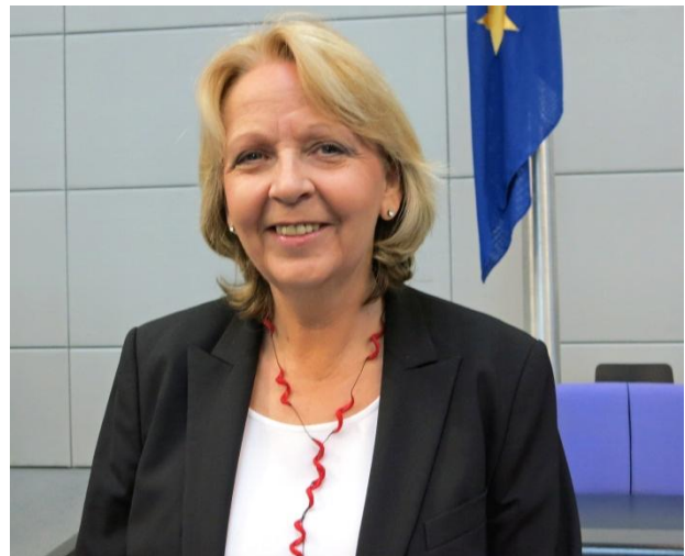
Die SPD geht mit Ministerpräsidentin Hannelore Kraft als Spitzenkandidatin in den Landtagswahlkampf