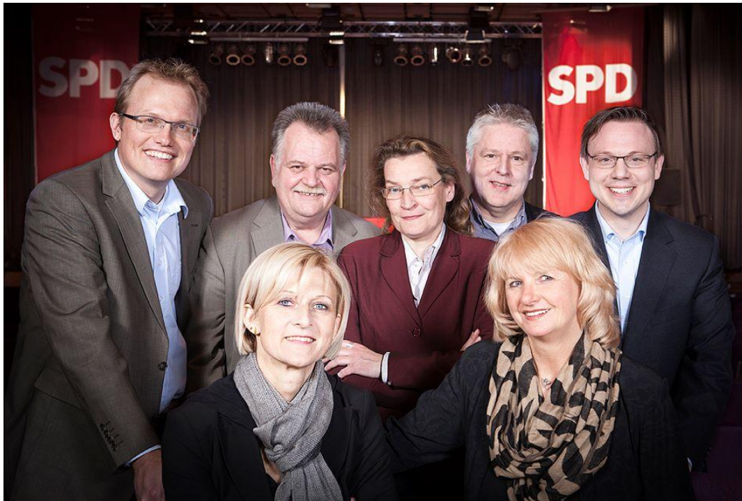
Das Kandidatenteam der Kölner SPD zur Landtagswahl am 13. Mai

www.martin-doermann.de/live/wp-content/uploads/2012/04/Wahlprogramm-Landtagswahl-2012.pdf