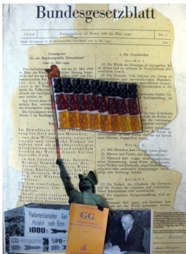
Collage von 2009 zu 60 Jahren Grundgesetz