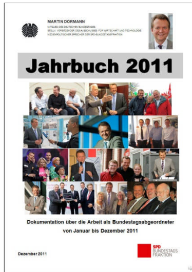
Dokumentation über die Arbeit als Bundestagsabgeordneter im Jahr 2011