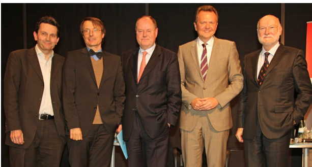
Kölner Abgeordnete mit Gästen

Die Gäste kamen mit hohen Erwartungen, vor allem an den Hauptredner Peer Steinbrück . Und sie wurden nicht enttäuscht. Der ehemalige Finanzminister sprach Tacheles zur Euro-Krise. Einerseits gab es Kritik am Krisenmanagement der Bundesregierung. Vor allem aber war seine Rede ein deutliches Plädoyer für Europa und den Euro: „Deutschland wird nur eine Chance in und mit Europa haben.“