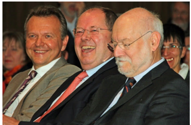
Peer Steinbrück hatte in Köln einen starken Auftritt vor 450 Gästen (Bericht auf Seite 5)