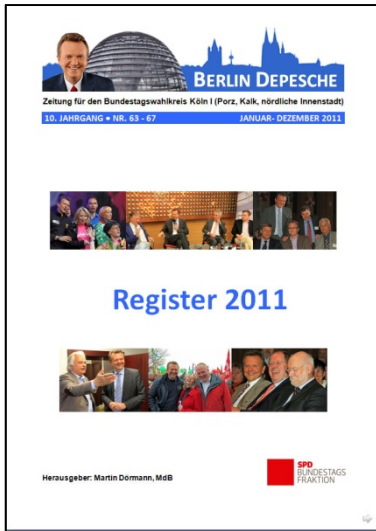
Thematisch gegliederte Auflistung der Berlin Depesche-Artikel 2011