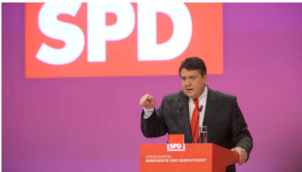
Sigmar Gabriel bleibt Parteivorsitzender

Mit wichtigen Beschlüssen in der Steuer- und Finanzpolitik, für Europa, Bildung, Gesundheit, Arbeit, Rente, Familie und für mehr direkte Demokratie entwickelt die SPD ihre Programmatik weiter. Mit einer Parteireform erneuert sie die Parteiorganisation. Das Ziel ist nun die Regierungsübernahme 2013.