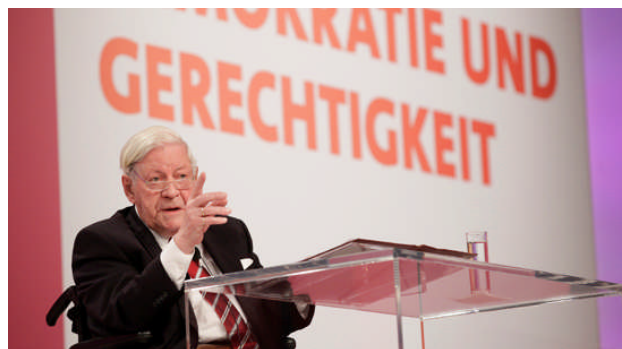
Helmut Schmidt zog mit seiner großen Europarede Delegierte und Gäste in seinen Bann

Auch Altkanzler Helmut Schmidt , der gleich zu Beginn des SPD-Bundesparteitags eine bewegende Rede zu den Delegierten und Gästen des Parteitages hielt, ließ an der Bundesregierung in puncto Europapolitik kaum ein gutes Haar. „Wenn ein deutscher Außenminister meint, dass ein Besuch in Kabul und Tripolis wichtiger sei als Athen, Lissabon und Dublin, und andere meinen, sie müssten eine Transferunion verhüten, dann ist das eine schädliche deutsch-nationale Kraftmeierei.“