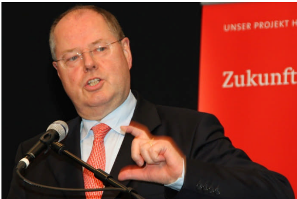
Ein engagierter Steinbrück