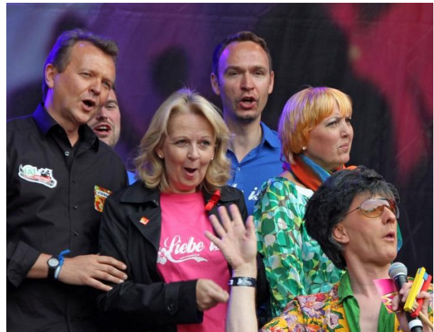
Hannelore Kraft war bei der Abschlusskundgebung des diesjährigen CSD auf dem Kölner Heumarkt bester Stimmung (Kurzbericht auf Seite 3)