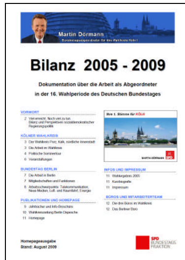
Dokumentation über die Arbeit als Bundestagsabgeordneter in der 16. Wahlperiode