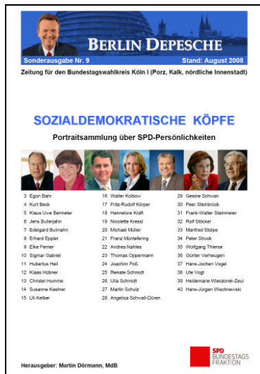
Sonderausgabe der Berlin Depesche: „Sozialdemokratische Köpfe“