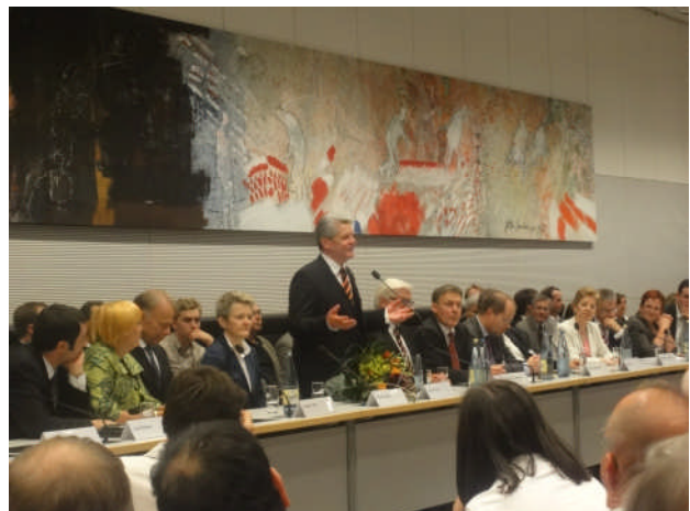
Joachim Gauck bedankte sich im Anschluss bei einer gemeinsamen Fraktionssitzung von SPD und Bündnis 90/Die Grünen