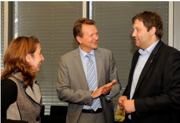
Die SPD-Abgeordneten Aydan Özoğuz, Martin Dörmann und Lars Klingbeil im Gespräch

Auf ihrer Klausurtagung am 17. Mai hat die Enquete-Kommission beschlossen, sich zu Anfang mit den Themen Netzneutralität, Urheberrecht und Datenschutz zu beschäftigen. Dazu werden Projektgruppen gebildet. Außerdem einigte sich die Kommission darauf, am 14. Juni die erste reguläre Sitzung abzuhalten. Am 5. Juli soll es eine Anhörung zum Thema: „Auswirkungen der Digitalisierung auf die Gesellschaft – Bestandsaufnahme und Zukunftsaussichten“ geben.