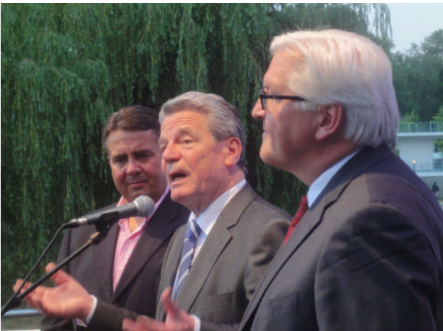
Joachim Gauck mit Sigmar Gabriel und Frank-Walter Steinmeier beim SPD-Fest am Vorabend

Folgende Kölner Sozialdemokraten waren Mitglieder der Bundesversammlung: die drei Bundestagsabgeordneten Martin Dörmann , Karl Lauterbach und Rolf Mützenich sowie die von Landtag entsandten Marc Jan Eumann , Jochen Ott und Norbert Walter-Borjans .