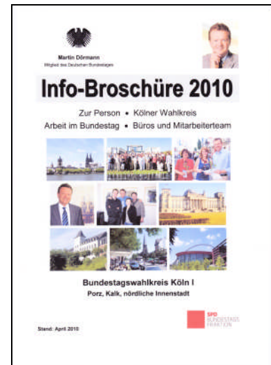
Allgemeine Informationen über den Wahlkreis, die Arbeit im Bundestag und das Arbeiterteam