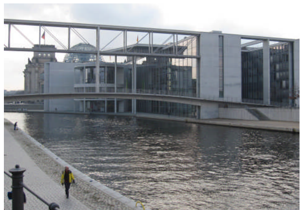
Das Berliner Abgeordnetenbüro von Martin Dörmann befindet sich im obersten Stock des Paul-Löbe-Hauses (auf dem Foto rechts)