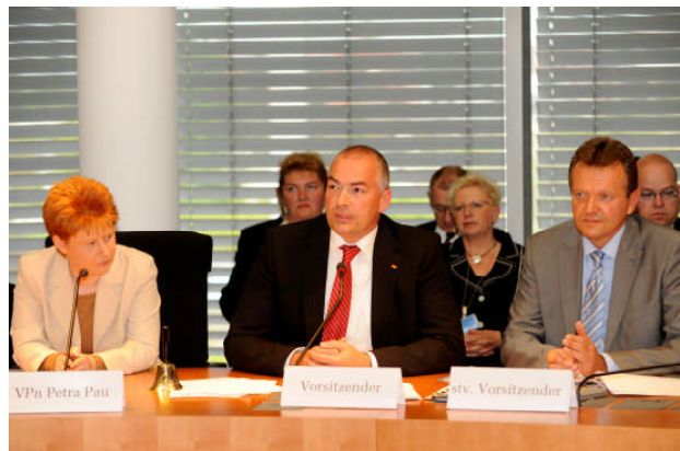
Bundestagsvizepräsidentin Petra Pau mit Axel E. Fischer und Martin Dörmann bei der konstituierenden Sitzung der Enquete-Kommission