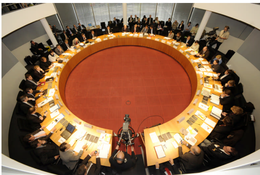
Blick in den Sitzungssaal der aktuellen Enquête.Kommission

→ Nähere Informationen zu Enquete-Kommissionen: www.bundestag.de