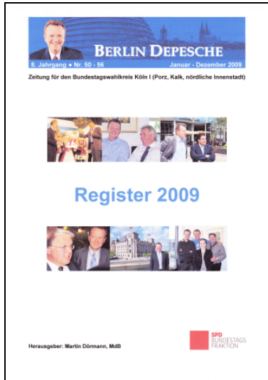
Thematisch gegliederte Auflistung der Berlin Depesche-Artikel 2009