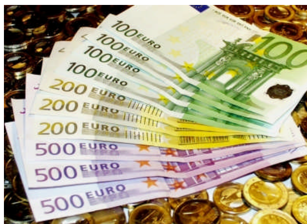
Wirtschaftlich verfehlt betreibt die schwarz-gelbe Regierung Klientelpolitik und treibt die Staatsverschuldung weiter in die Höhe

Die Absenkung der Umsatzsteuer für Übernachtungsleistungen in Hotels wird keinerlei positive Wachstumswirkungen haben. Nach aller Erfahrung kann von einer Weitergabe der Steuerermäßigung an die Kunden und Beschäftigten nicht ausgegangen werden. Die Einführung dieser neuen Subvention birgt deshalb das Risiko hoher zusätzlicher Steuerausfälle.