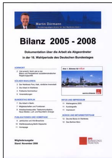
Dokumentation über die Arbeit als Bundestagsabgeordneter in der 16. Wahlperiode