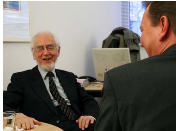
Gut gelaunt: Erhard Eppler