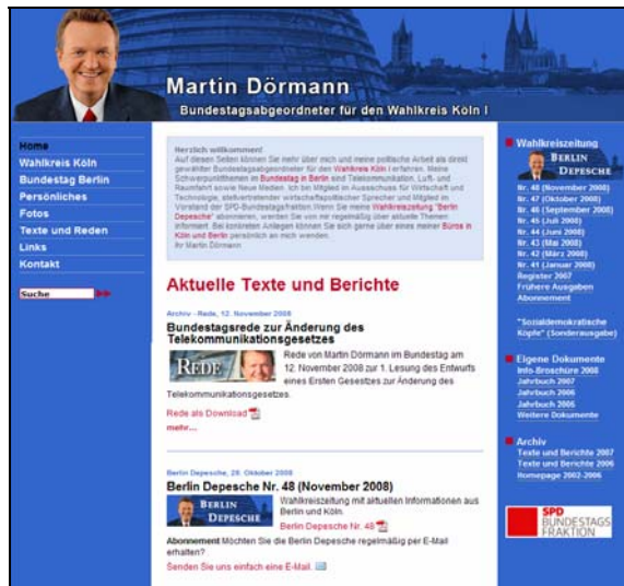
Startseite der Internet-Homepage www.martin-doermann.de

Weitere allgemeine und aktuelle Informationen finden sich auf der Homepage: www.martin-doermann.de . Die Homepage enthält u.a. Seiten zu Persönlichem, dem Kölner Wahlkreis, der Arbeit in Berlin, aktuelle Presse, Texte und Dokumente sowie zahlreiche Fotos.