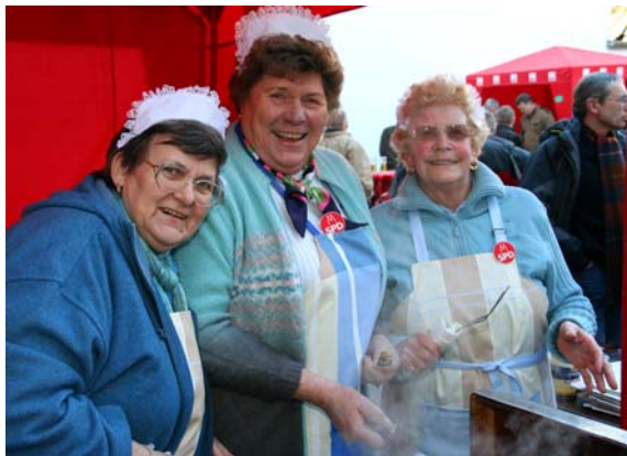
Einfach charmant: die drei Damen vom Rievkoche-Stand