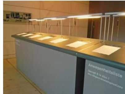
Anwesenheitsliste im Reichstag

8:50 Uhr: Ausschuss für Wirtschaft und Technologie. In einer kurzen Sitzung wird formal die Durchführung einer Anhörung zum Vergaberecht beschlossen.