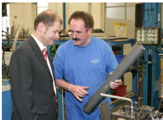
Austausch über den Produktionsvorgang

Anschluss daran die Arbeitsvorgänge vor Ort zeigen, um sich ein Urteil über die schwierige und anstrengende Arbeit unter dem Gesichtspunkt, was gute Arbeit für ältere Mitarbeiterinnen und Mitarbeiter ausmacht, zu bilden.