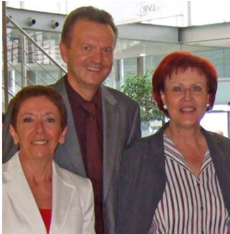
Lale Akgün und Martin Dörmann mit Heidemarie Wieczorek-Zeul

„Entwicklungspolitik schafft Perspektiven“ – bereits der Titel machte klar, worum es bei dieser Veranstaltung ging. Rund 140 Teilnehmer kamen in das Horion-Haus nach Deutz, um mit Heidemarie Wieczorek-Zeul zu diskutieren. Die Bundesministerin für wirtschaftliche Zusammenarbeit und Entwicklung ist seit 1998 im Amt und damit die dienstälteste Bundesministerin Deutschlands.