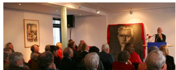
Eppler-Rede im neuen August-Bebel-Forum