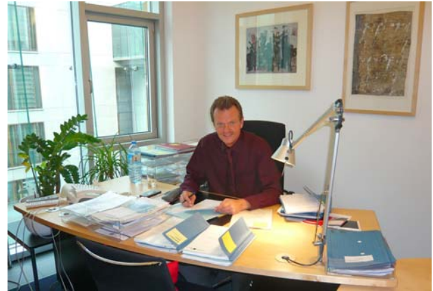
Am Schreibtisch im Büro

17:00 Uhr: Vorstand der SPD-Bundestagsfraktion . Wir bereiten die Fraktionssitzung sowie die Plenumswochen vor und diskutieren zu aktuellen Themen.