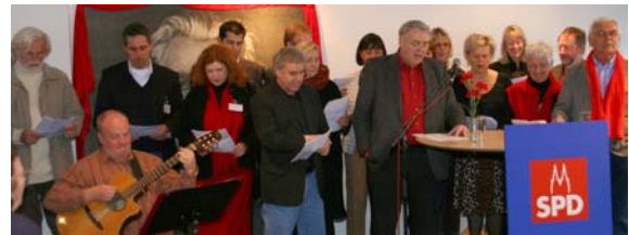
Starke Stimmen: der Arbeiterlieder-Chor