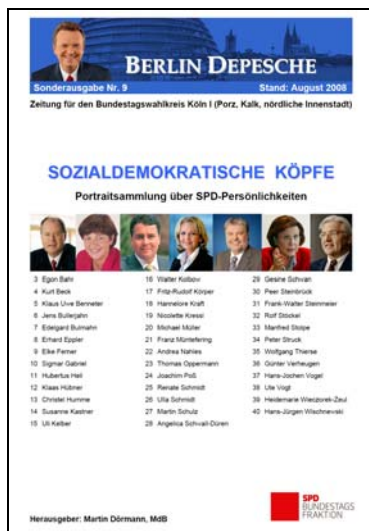
Sonderausgabe der Berlin Depesche: „Sozialdemokratische Köpfe“