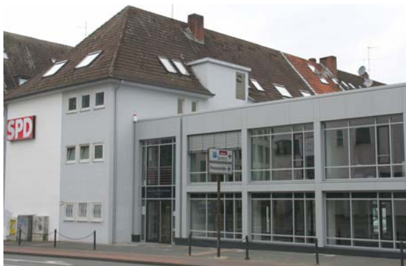
Das „Hans-Jürgen Wischnewski Haus“ in der Magnusstraße: die komplett umgebaute Heimstätte der KölnSPD mit neuer Außenfassade

Mit einem großen Rahmenprogramm feierte die KölnSPD am 17. Februar die Neueröffnung ihres Parteihauses in der Innenstadt, dessen Eingang nun an der Magnusstraße 18b liegt. Benannt wurde das Gebäude nach dem früheren Kölner Parteivorsitzenden und Spitzenpolitiker Hans-Jürgen Wischnewski .