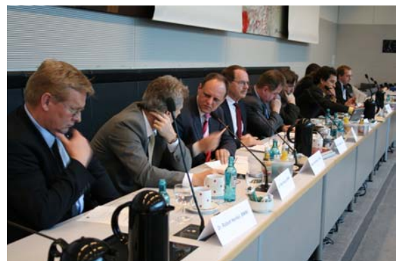
Führende Experten standen Rede und Antwort

Die Veranstaltung befasste sich mit den politischen, technischen und finanziellen Rahmenbedingungen. Bereits heute bestehen neben DSL unterschiedliche technische Möglichkeiten der Breitbandversorgung, von Kabelnetzen bis hin zu modernen Funktechnologien, die von einer Vielzahl von Unternehmen angeboten werden. Diese wurden neben Hilfestellungen und Best-practice-Beispielen von sachkundigen Experten aus Politik, Wirtschaft und Verbänden näher vorgestellt. Die Veranstaltung erhielt viel Lob von allen Seiten.