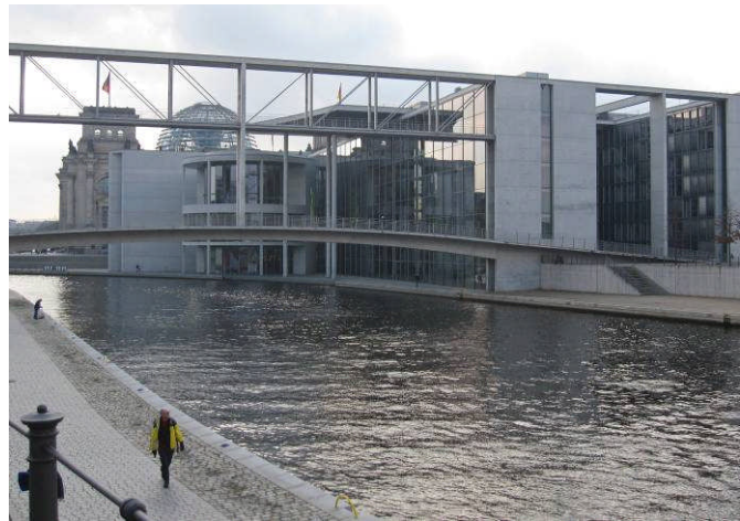
Das Büro befindet sich im obersten Stock des Paul-Löbe-Hauses (auf dem Foto rechts) und hat einen seitlichen Blick zur Spree hin