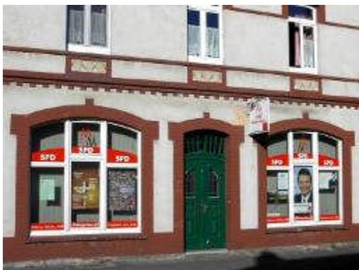
Wahlkreisbüro in Porz