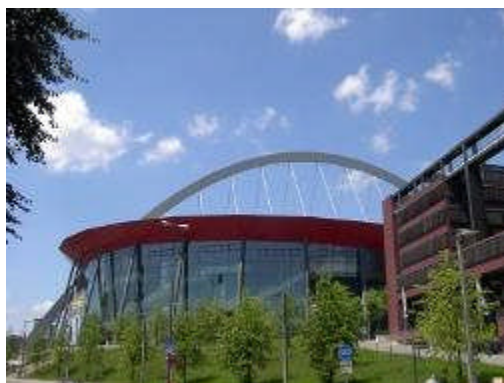
Kölnarena in Deutz