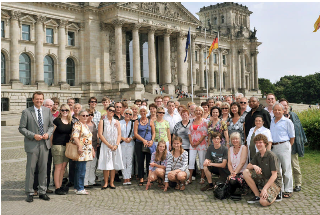
Besucherguppe aus Köln zu Gast in Berlin