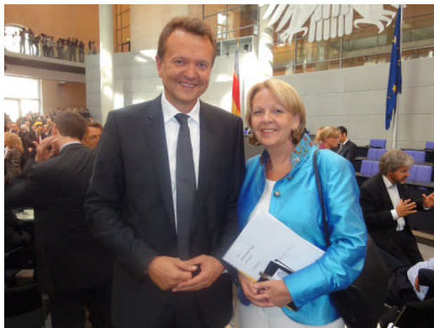
Martin Dörmann und Hannelore Kraft als Mitglieder der Bundesversammlung