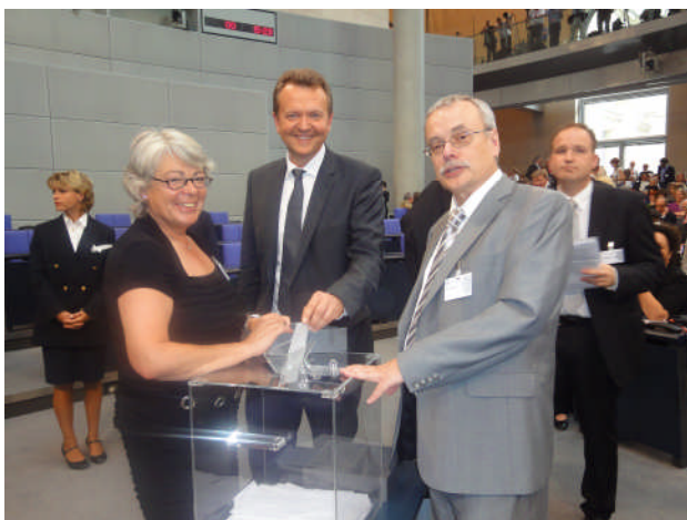
Stimmabgabe im Plenarsaal