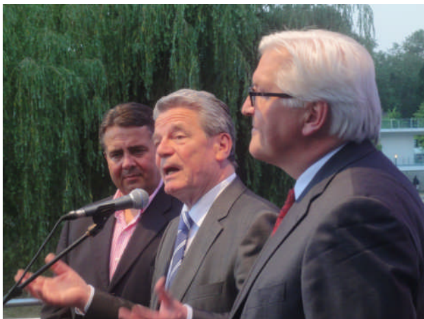
Joachim Gauck mit Sigmar Gabriel und Frank-Walter Steinmeier beim SPD-Fest am Vorabend