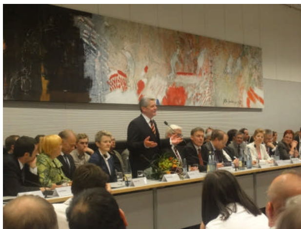
Joachim Gauck bedankte sich im Anschluss bei einer gemeinsamen Fraktionssitzung von SPD und Bündnis 90/Die Grünen