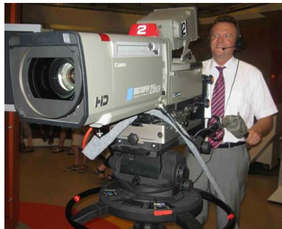
„Kamerateam“ im Studio des ARD-Morgenmagazins