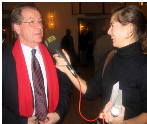
Franz Müntefering im Interview mit Radio Köln