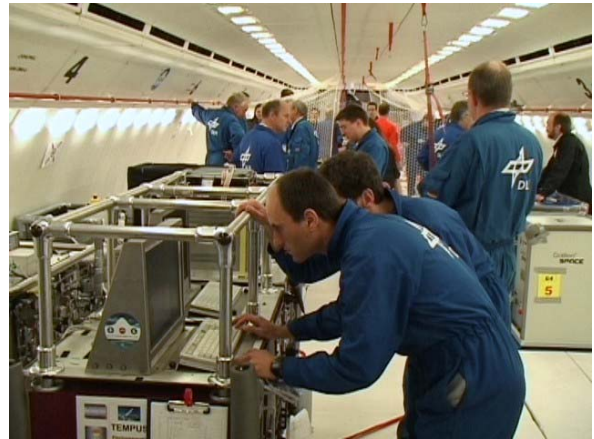
Hochtechnisches Gerät im Airbus

Parabelflüge mit Flugzeugen bieten eine regelmäßige Gelegenheit für die Forschung und Technologieerprobung in Schwerelosigkeit. Sie bieten außerhalb der Raumstation ISS die einzige Möglichkeit, den Körper des Menschen in Schwerelosigkeit zu erforschen. Einige Untersuchungen bereiten ein umfangreiches Weltraumexperiment vor oder begleiten Experimente auf Raketen. Für andere Themen reichen die kurzen Schwerelosigkeitsphasen bei Parabelflügen bereits aus.