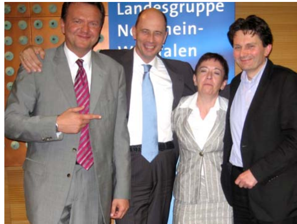
Lockere Runde: Tiefensee (Mitte) mit den Kölner Abgeordneten Dörmann, Akgün und Mützenich

an die Länder gezahlt werden. Tiefensee zeigte Verständnis für die kritischen Nachfragen, verwies jedoch auf die angespannte Haushaltslage und die deutlich höheren zusätzlichen Einnahmen der Länder durch die Mehrwertsteuererhöhung.