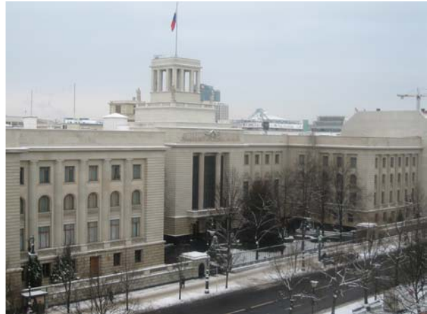
Zimmer mit Aussicht – Gerhard Schröder blickt nun von seinem Büro auf die Russische Botschaft und das Brandenburger Tor statt auf den Reichstag