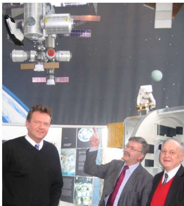
Am Modell der Raumstation ISS