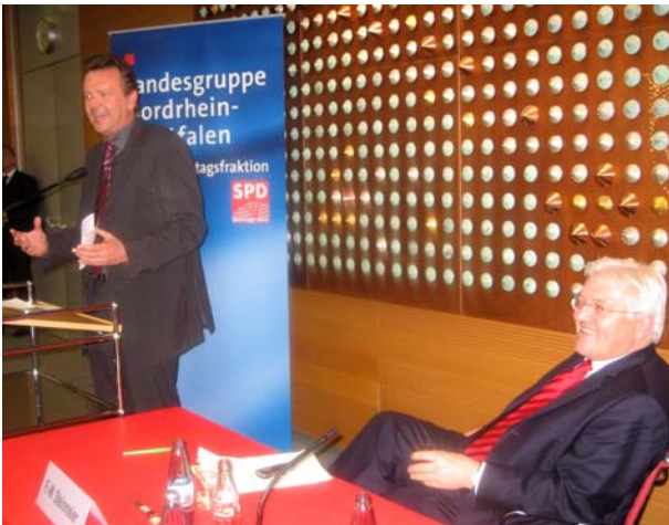
Obwohl er gerade erst aus dem Nahen Osten kam, war Frank-Walter Steinmeier ganz entspannt

Mit gut 40-minütiger Verspätung erreichte Steinmeier den voll besetzten Saal im Landschaftsverband Rheinland. Er kam direkt aus Damaskus eingeflogen, wo zuvor seine mehrtätige Reise in den Nahen Osten endete. In seinem Vortrag ging der Außenminister daher auch auf die aktuelle Entwicklung dort ein und berichtete über die Mühen der Außenpolitik im 21. Jahrhundert. Steinmeier bekräftigte in seiner Rede den Wunsch, Konflikte in der Welt durch friedliche Lösungen zu beenden. Die Sozialdemokratie sehe sich auch in Zukunft als Partei des Friedens.